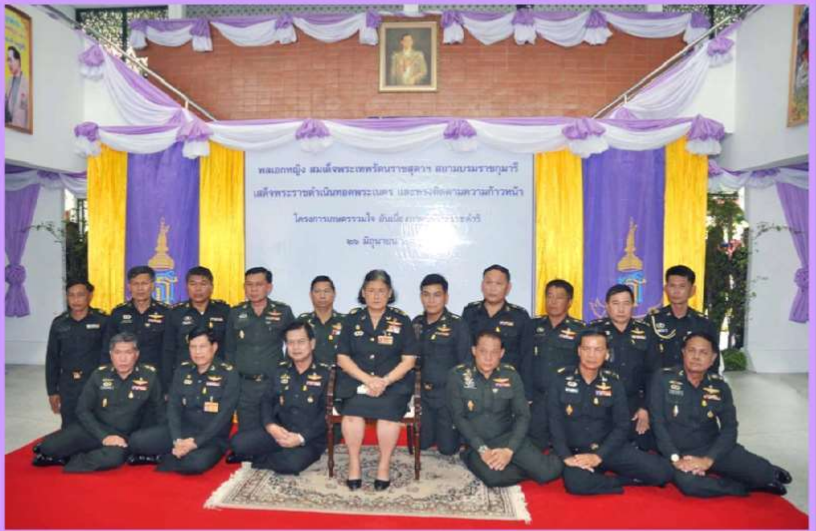
พล.อ.หญิง สมเด็จพระเทพรัตนราชสุดาฯ สยามบรมราชกุมารี เสด็จพระราชดำเนินทอดพระเนตร และทรงติดตามความก้าวหน้า โครงการฯ เมื่อ ๒๖ มิ.ย.๕๕