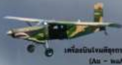
เครื่องบินโจมตีขบวนที่ ๗ (Au - ๗๐A)